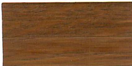
カスタムブラウン